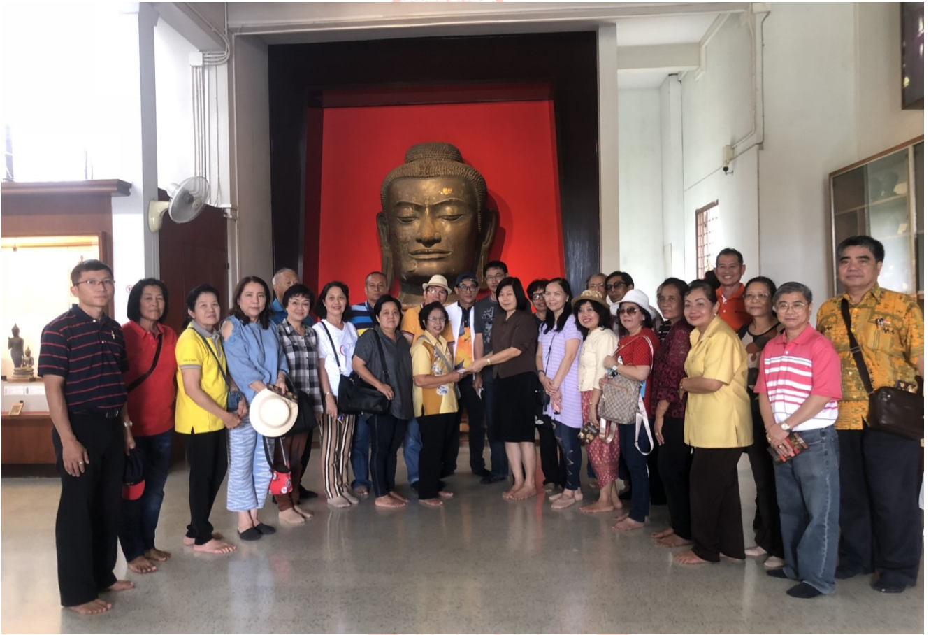
ในงานเลี้ยงสังสรรค์ภาคค่ำ มีผู้แทนจากสมาชิกแต่ละมหาวิทยาลัยที่มาร่วมงาน ได้กล่าวแสดงความรู้สึกที่มีต่อสหกรณ์ ดังนี้