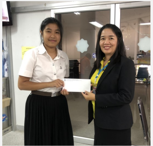
ทุนการศึกษาบุตร ประเภททุนเรียนดี-ระดับปริญญาตรี

“ดีใจมากคะที่ได้เป็นส่วนหนึ่งของคนที่ได้รับทุน เพราะว่าตนเองได้รับทุนนี้มาประมาณ 7 ปี แล้ว ก็หวังว่าทุนนี้ยังมีอีกต่อไปเรื่อย ๆ นะคะ ขอขอบคุณมากคะ”