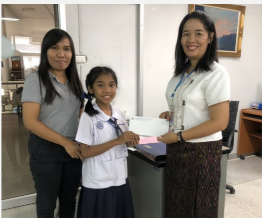
ทุนการศึกษาบุตร ประเภททุนเรียนดี-ระดับประถมศึกษา

สมาชิกติดต่อขอรับเงินทุนส่งเสริมการศึกษานักเรียนได้ตั้งแต่วันที่ 25 กันยายน 2561 เป็นต้นไป ส่วนหนึ่งของนักเรียน นิสิต นักศึกษา ที่ได้รับทุนการศึกษา ได้กล่าวแสดงความรู้สึกที่ได้รับทุนการศึกษา ดังนี้